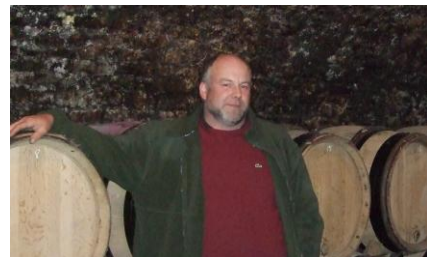
【ラフォンで小作人を務めた ポール・ガローデ】

そんな産地を昔からリードするのが、『モンテリーの祖』ポール・ガローデです。モンテリーの名を広く世に知らしめた人物で、アペラシオンを一から築き上げ、今日までモンテリー協会会長として精力的に活動してきました。ムルソーで4世代に渡る家族経営のドメヌを運営し、かつてコント・ラフォンの契約農家も務めていました。現在コント・ラフォンは、栽培から醸造まで自社で一貫して行っていますが、ドミニク・ラフォンが当主となる前は、ブドウを契約農家に任せていました。このためガローデのワインはコント・ラフォンの影響を強く受け、芳醇で余韻の長い複雑な味わいが特徴です。